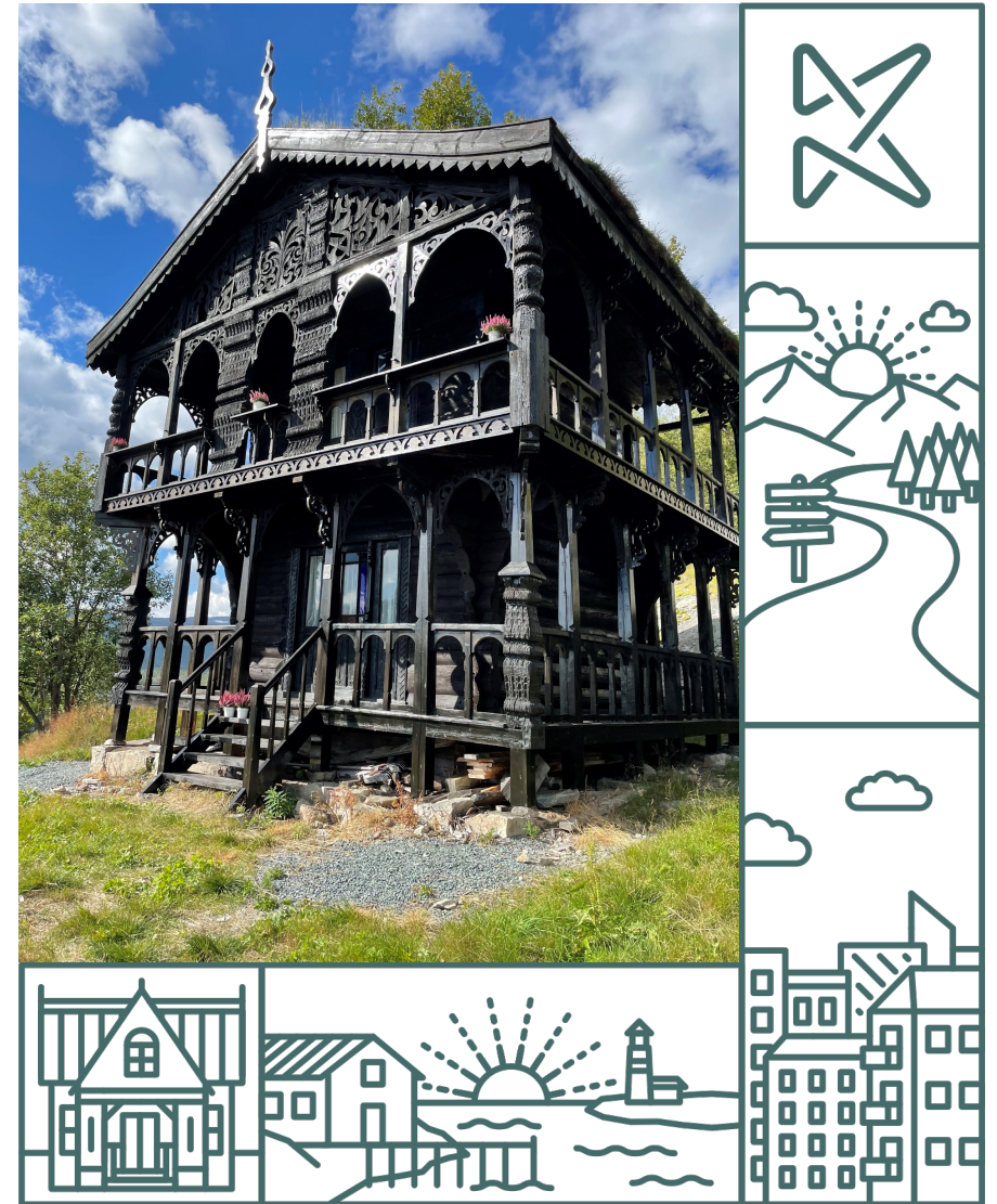
Botn skystasjon, Vinje