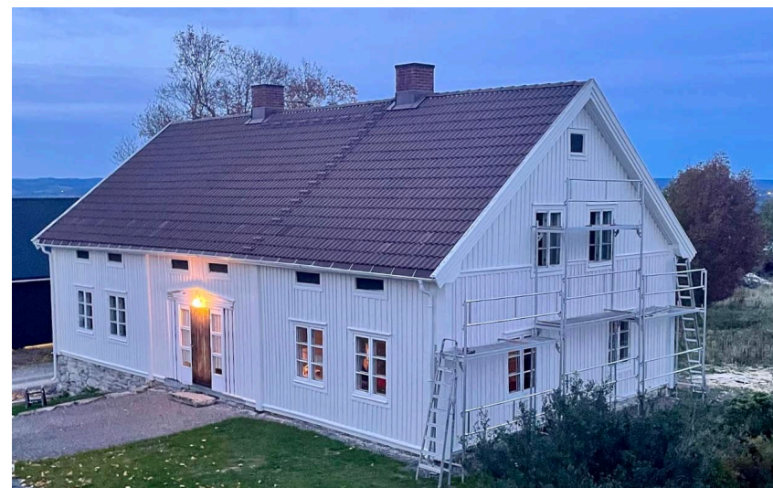
Aas gård, Gjøvik